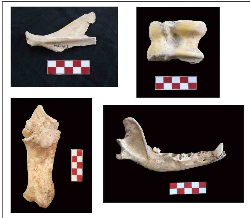
تصویر ۴. تعدادی از نمونه‌های استخوانی محوطه تقی آباد (نگارندگان، ۱۳۹۷).