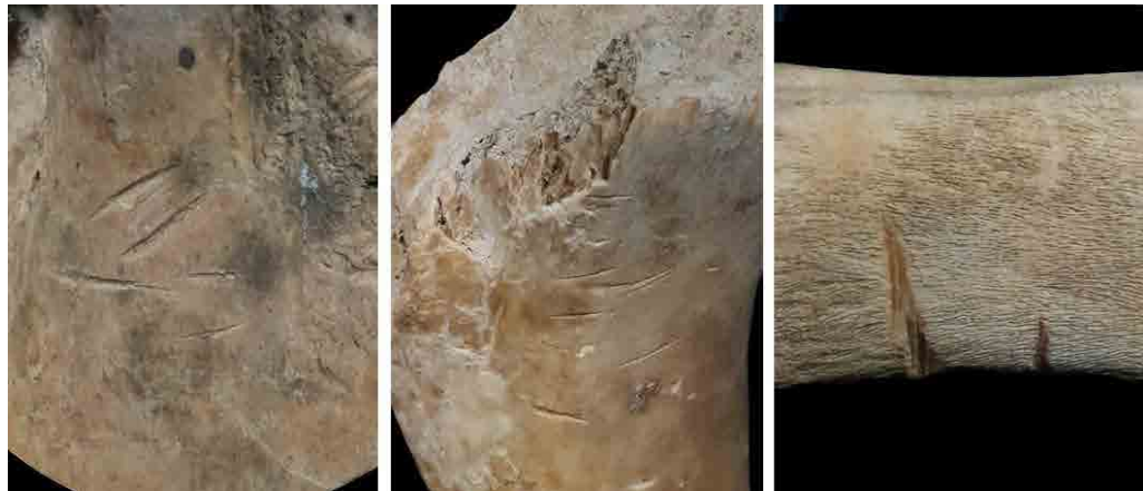
تصویر ۵. آثار برش بر روی نمونه‌ها در زیر میکروسکوپ (نگارندگان، ۱۳۹۹).