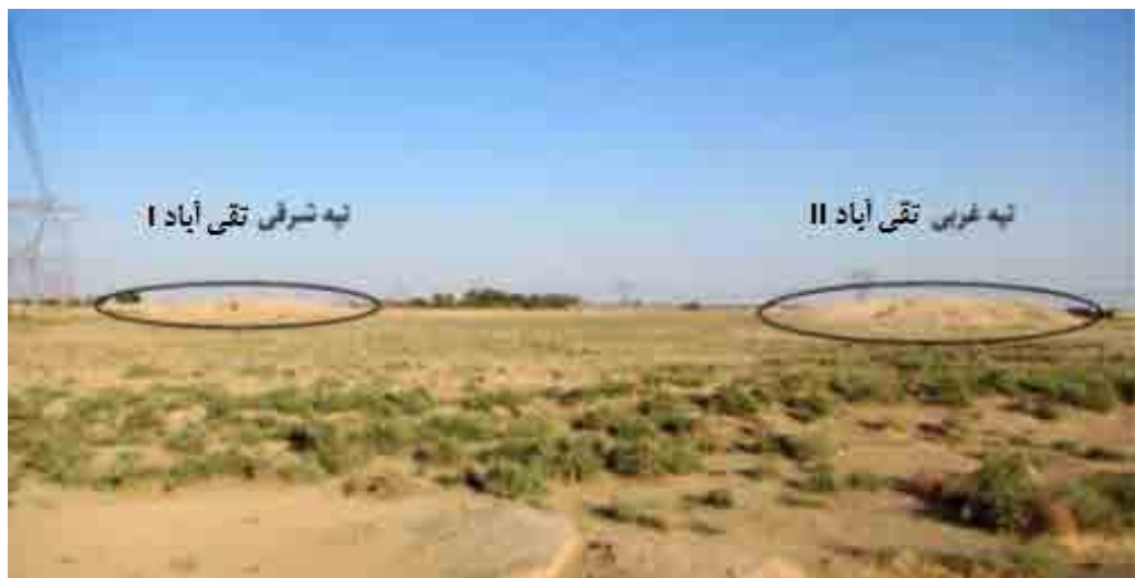
تصویر ۳. نمایی از محوطه دو تپه غربی و شرقی تپه تقی آباد (نگارندکان، ۱۳۹۷).

۴۳٫۴ و در ارتفاع ۸۹۱ متر از سطح دریا قرار دارد. هردو برجستگی تپه تقی آباد به دلیل حفاری‌های غیرمجاز و هم‌چنین تسطیح دامنه‌های مختلف آن توسط کشاورزان دچار تخریب و آسیب‌های فراوانی شده است، در سطح مجموعه و حدفاصل برجستگی هر دو تپه انواع سفال‌های خاکستری و نخودی عصر آهن به وفور به چشم می‌خورد. در دیواره برش خورده و گودال‌های حفاری غیرمجاز نیز آثار انواع خشت و سازه‌های معماری و در نمای دیواره‌ها نیز لایه‌های مختلف خاکستر قابل مشاهده بود. این دو تپه در بین زمین‌های کشاورزی احاطه شده است (تصویر ۳)، (برای اطلاع بیشتر از یافته‌های فرهنگی و گاه‌نگاری تپه تقی آباد ر. ک. به: محمدیارلو و همکاران، ۱۴۰۰).