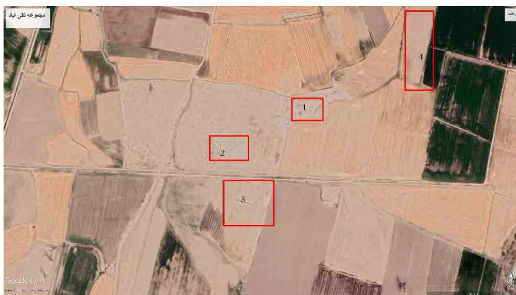
تصویر ۲. موقعیت مجموعه تقی‌آباد نسبت به هم (نگارندگان، ۱۳۹۷).